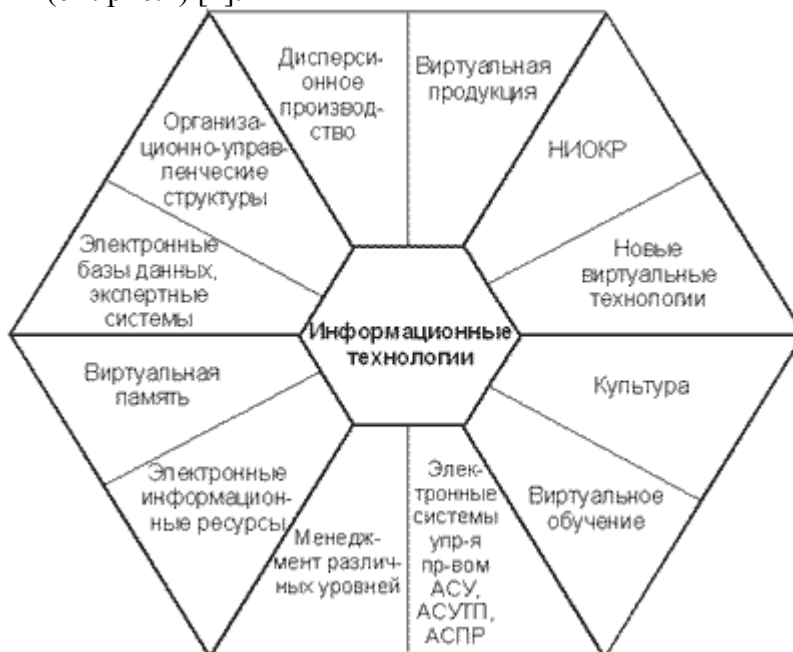
Рис.2. Исследовательская модель виртуального предприятия.

Специалистами информационно-коммуникационных технологий была создана исследовательская модель виртуального предприятия, где показаны во взаимосвязи важнейшие элементы, с помощью которых организация способна выжить в современных рыночных условиях (см. рис.2) [4].