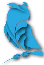
Рис. 1 Оформление рисунков и иллюстраций. Рисунки только в формате .jpg

В основе современных исследований лежат фундаментальные понятия. Эти понятия базируются на нескольких составляющих... [1].